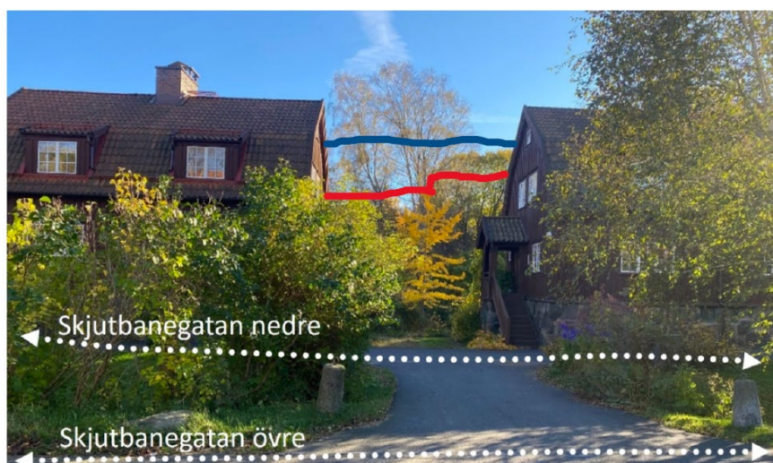
Figur 24 Siktlinje mellan byggnaderna vid Skjutbanegatan och mot Viggelidens parkområde. Foto från Antikvarisk konsekvensbedömning, Göteborgs stad.

Bilden från sid 36 i Nyare planbeskrivning