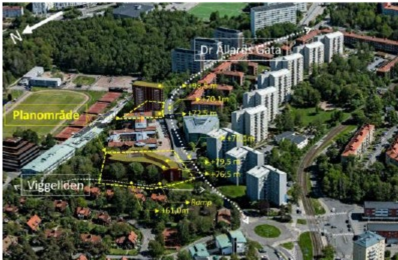
Figur 3 Flygfoto över planområdet och dess omland. Redovisning av förutsättningar på platsen.

Problemet med höjden är mindre sett från Doktor Allards gata, men sett från Landala Egnahem så är situationen en helt annan och det är också utifrån den blickpunkten den föreslagna ändringen ska värderas. Bilden nedan är tagen från gångbanan norr om fastigheterna Skjutbanegatan 35 – 37 och i sydlig riktning. Även på det avståndet, mot den föreslagna exploateringen, så framstår byggnaden som inträngande. Om man förflyttar sig närmare Viggeliden kommer upplevelsen av den föreslagna fastigheten att bli överväldigande.